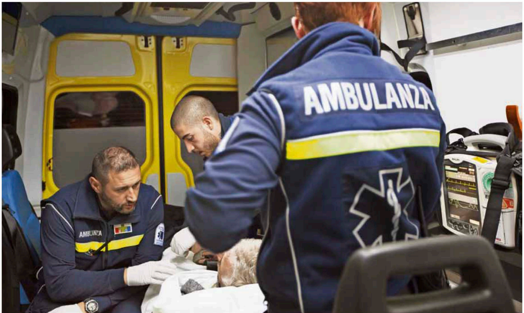
Le ambulanze della Croce Verde di Lugano servono un bacino di utenza di circa 150'000 abitanti (galleria fotografica su www.azione.ch ).

A Pregassona, periferia di Lugano, un edificio degli anni Ottanta ospita il quartier generale della Croce Verde luganese, un'associazione privata senza scopo di lucro riconosciuta d'utilità pubblica, apolitica e aconfessionale. L'associazione gestisce tre settori, molto diversi uno dall'altro. Il primo è il servizio ambulanza, la cui principale vocazione è il trasporto dei feriti e dei malati. Il secondo è il servizio medico dentario, che offre cure di qualità a prezzi modici. Infine, la Croce Verde impartisce anche