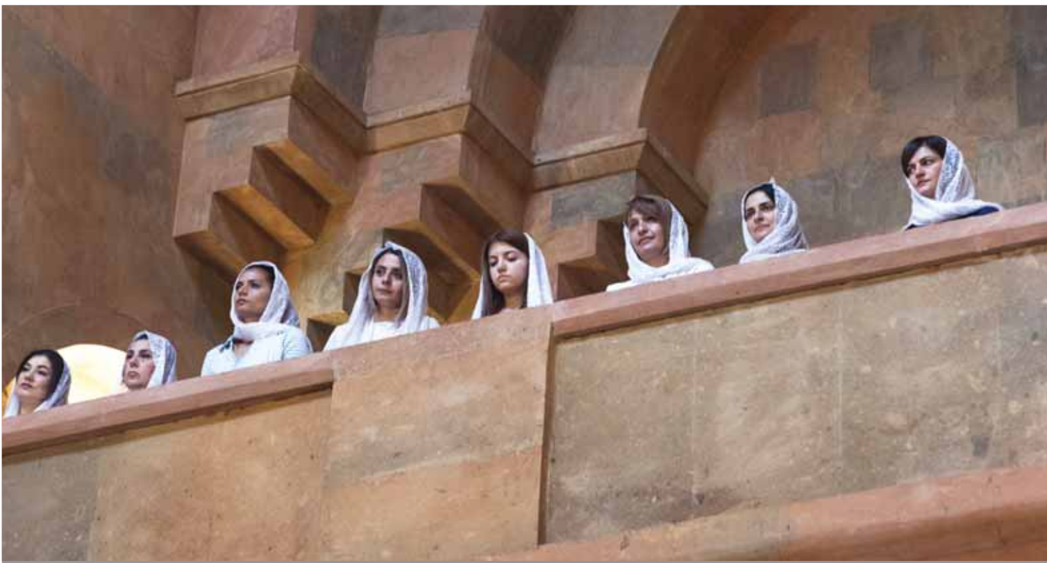
Eglise apostolique arménienne dans la cathédrale de la Sainte Mère de Dieu à Stepanakert. Les femmes de la chorale se tiennent sur un balcon pendant la messe du dimanche.

affrontés avec une brutalité indescriptible: pillages, assassinats de civils et destruction de villages entiers étaient courants. Lorsque, épuisées, les deux parties ont signé un cessez-le-feu, les Arméniens avaient pris le contrôle de la majorité du Haut-Karabagh. Mais entre 25'000 et 50'000 personnes avaient perdu la vie et des centaines de milliers leur maison.