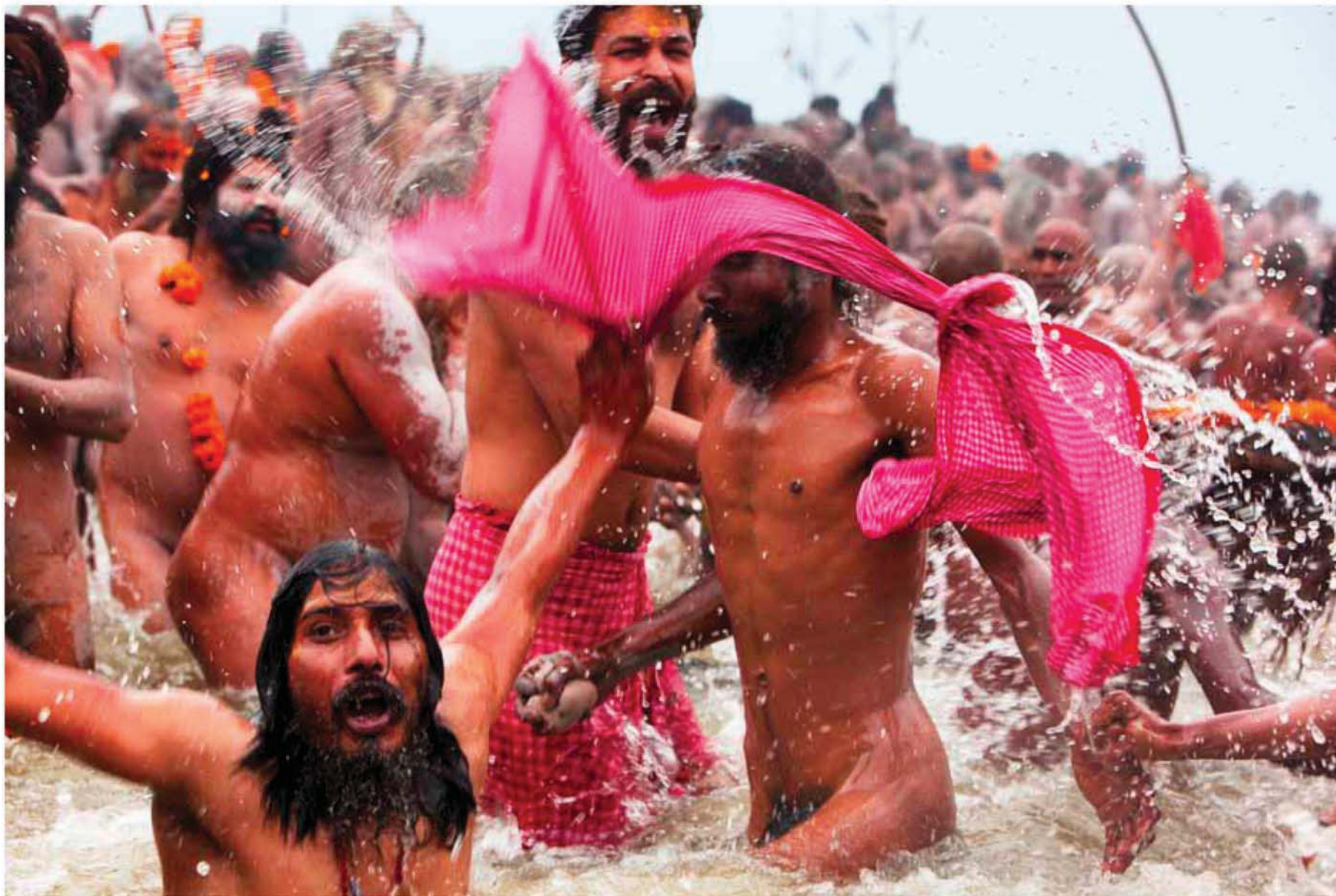
15 février 2013 – Les Sâdhus (saints hommes, souvent appelés Baba par le Indous) sont des ascètes. Des moines errants qui ont renoncé à tous biens matériels, même aux choses simples comme les vêtements. Ils ont choisi de vivre en dehors de la société afin de se concentrer sur leur propre pratique spirituelle.