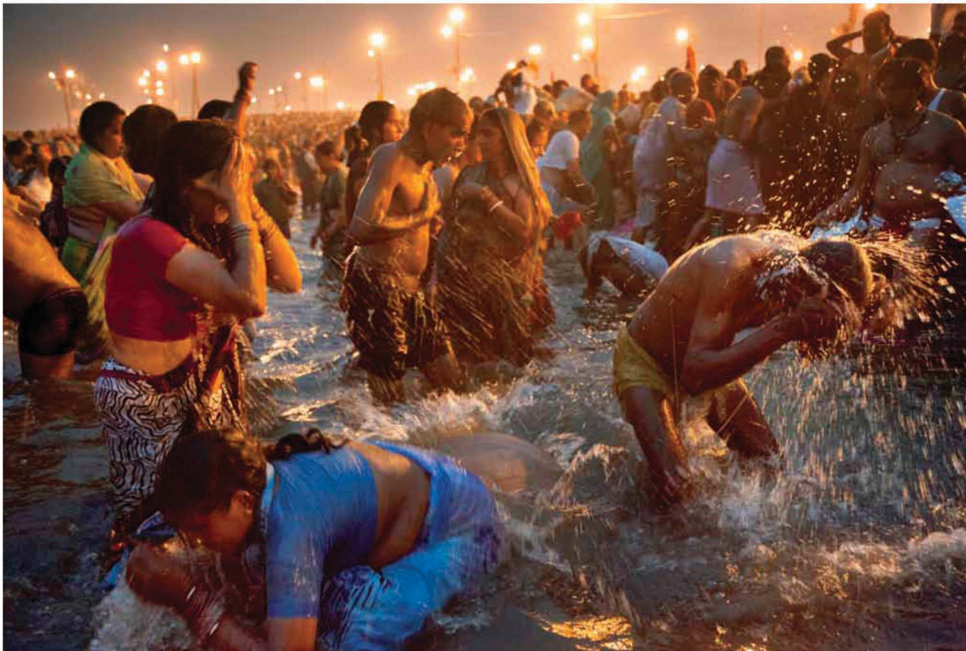
15 février 2013 – Le rituel du « Bain royal » le cinquième jour de la nouvelle lune, le jour très précis où l'alignement planétaire est de bon augure, les croyants disent que l'énergie spirituelle s'écoule vers la terre.

Didier Ruef, par ses images, nous rappelle la beauté que représentent des millions d'indiens rassemblés dans une même ferveur. Bon voyage. ■