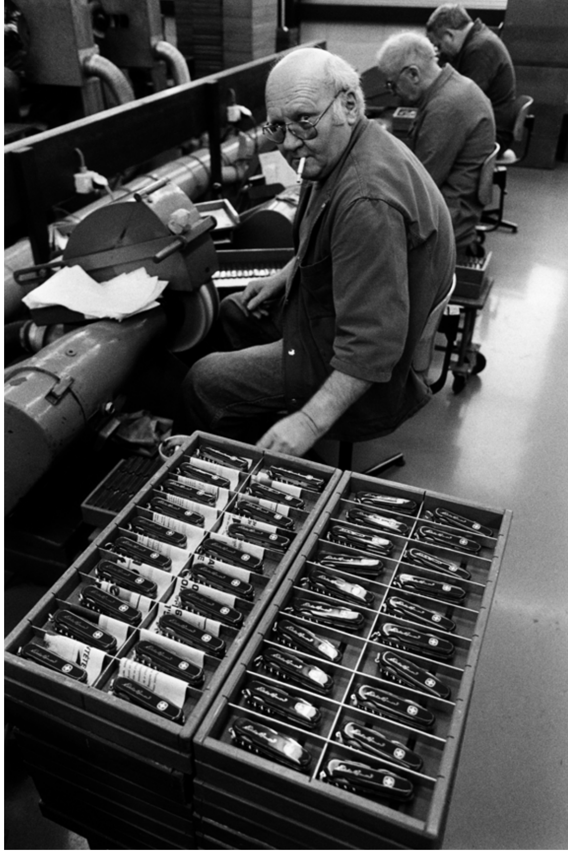
Usine Wenger, Delémont, 1992